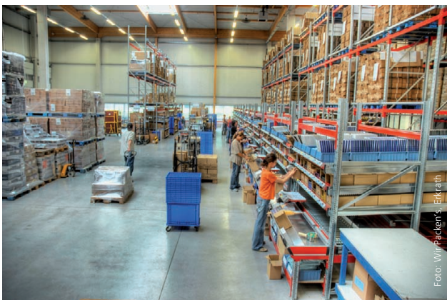
Wir Packen's, Erkrath 4.000 m 2 , 2007