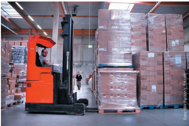
Wir Packen's, Erkrath 4.000 m 2 , 2007