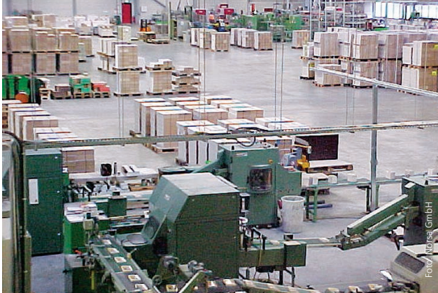
PSC, Pößneck 5.700 m 2 , 2002